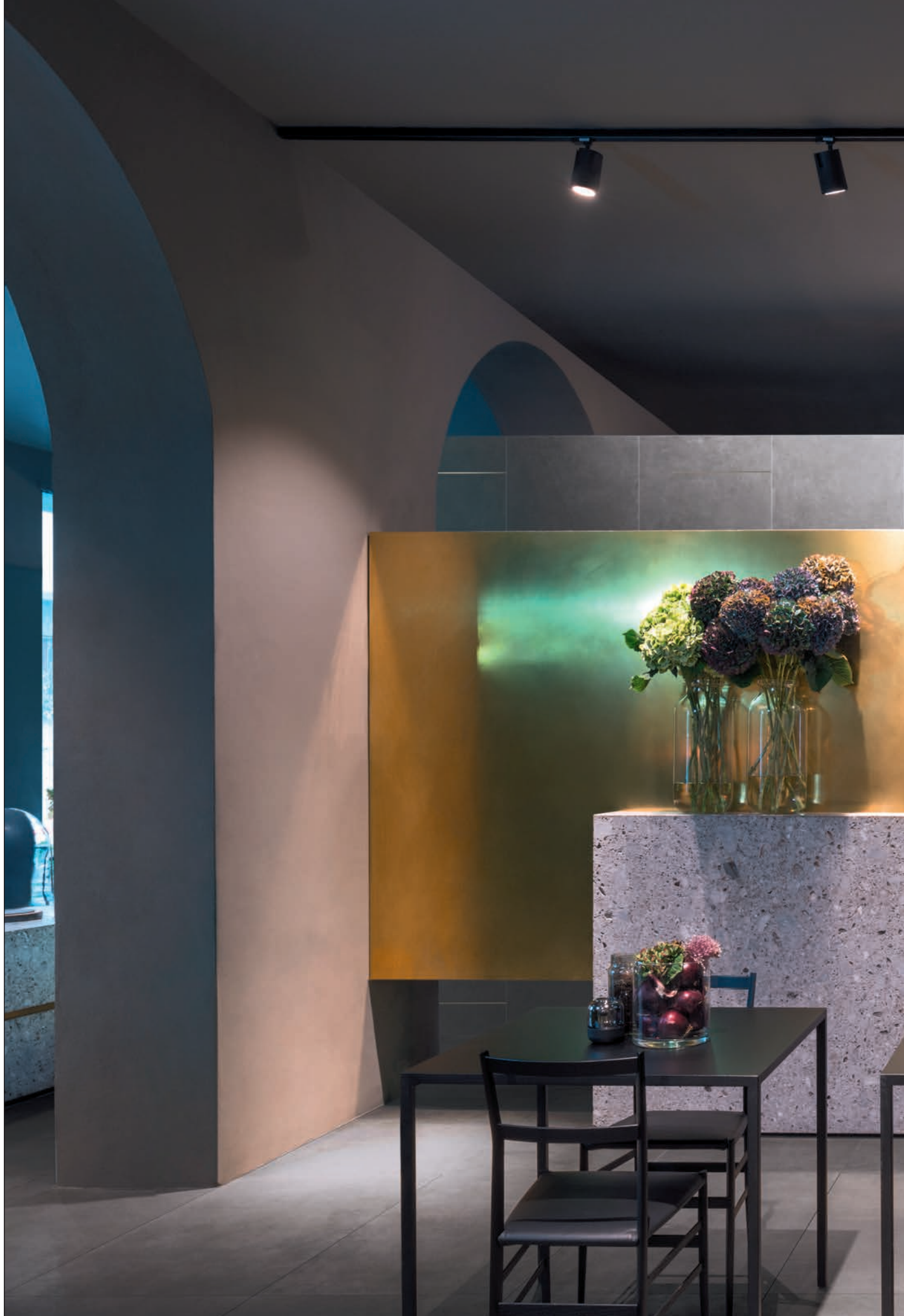
LIVING , pavimento / flooring LINES 1A (cm. 60x120 - 24"x48"), Rivestimento / covering LINES 1B (cm. 60x60 - 24"x24")