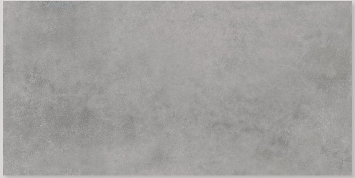
LINES 1A - PEI IV / R10 / DCOF