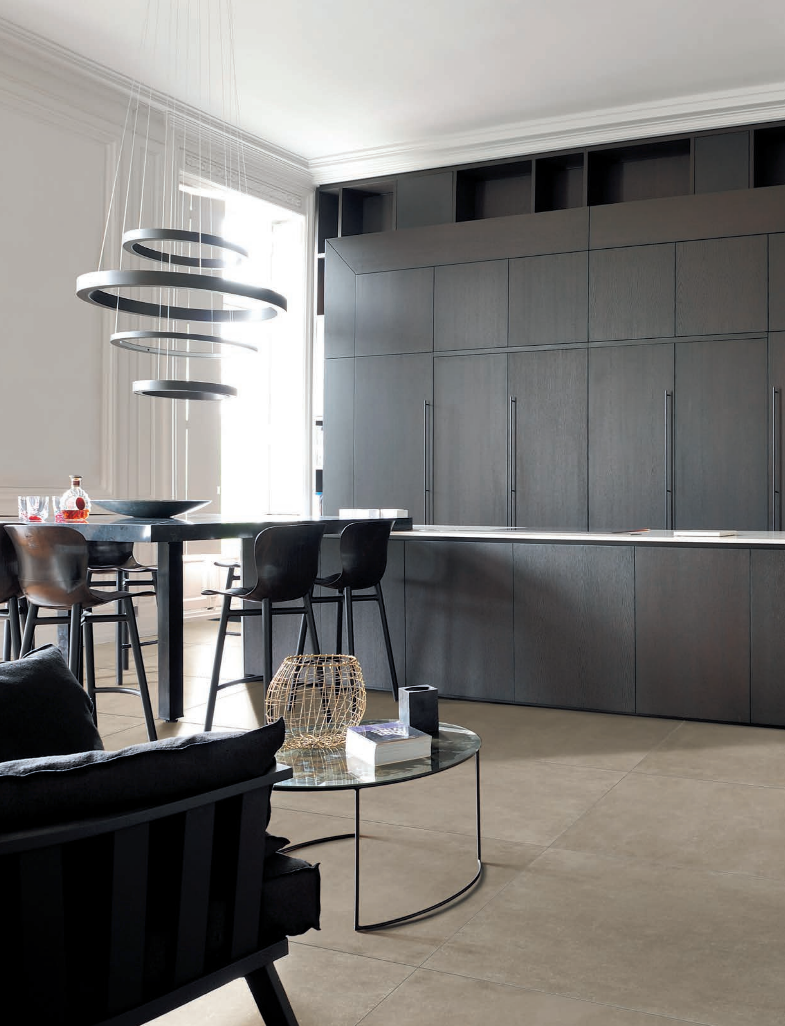
CUCINA/KITCHEN, pavimento / flooring LINES 2A-3A (cm. 60x120 - 24"x48")