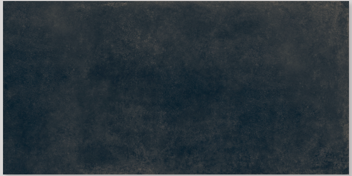
LINES 3A - PEI III / R10 / DCOF