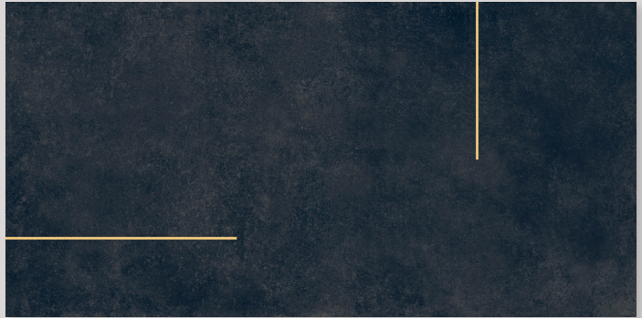
★ LINES 3B - PEI III / R10 / DCOF - (con listello ottone o acciaio - with brass or steel strip)