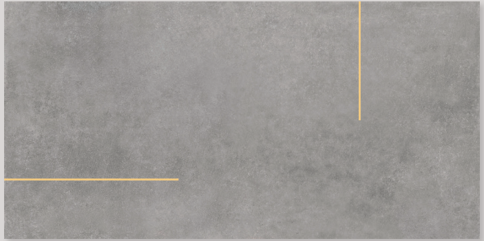
★ LINES 1B - PEI IV / R10 / DCOF - (con listello ottone o acciaio - with brass or steel strip)