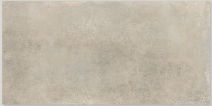
LINES2A - PEI IV / R10 / DCOF