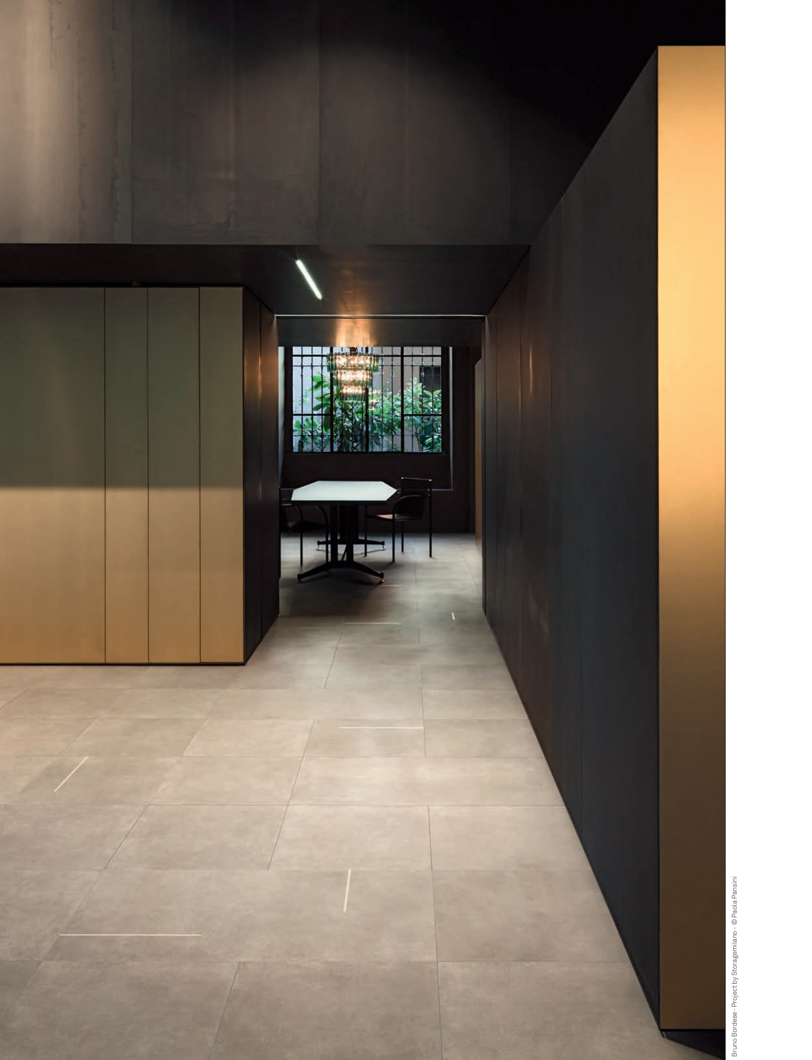
LIVING, pavimento / flooring LINES 2A-2B (cm. 60x120 - 24"x48" - cm. 60x60 - 24"x24")