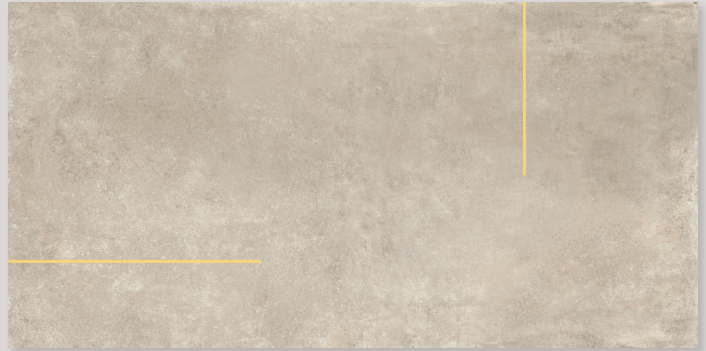
★ LINES2B - PEI IV / R10 / DCOF - (con listello ottone o acciaio - with brass or steel strip)